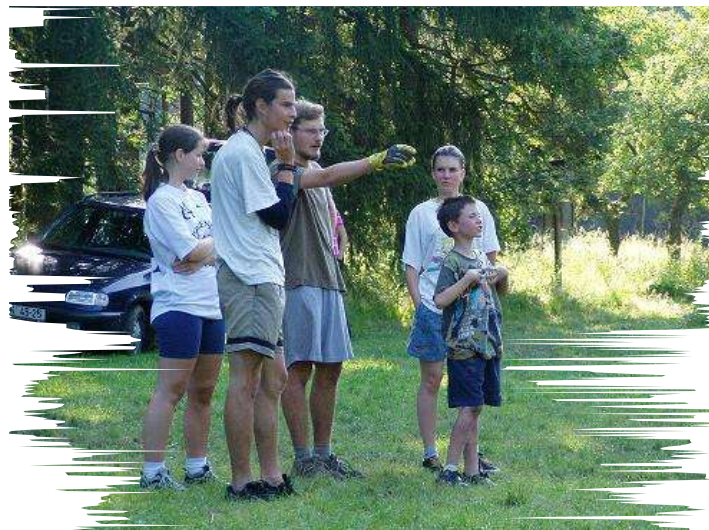
Poslední pokyny před výkopem